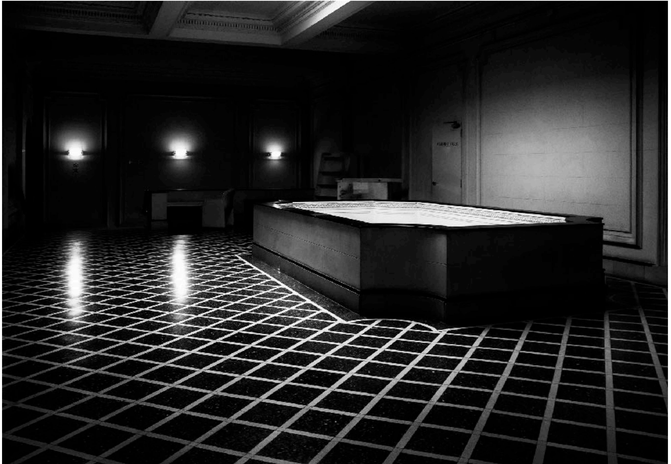
Teatro 25 de Mayo