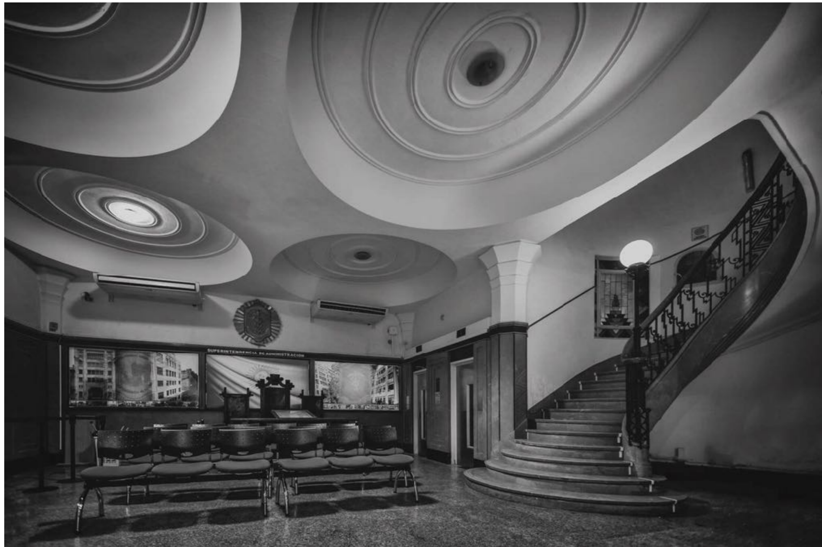
Diario Crítica (agradecimiento a Fundación OSDE)