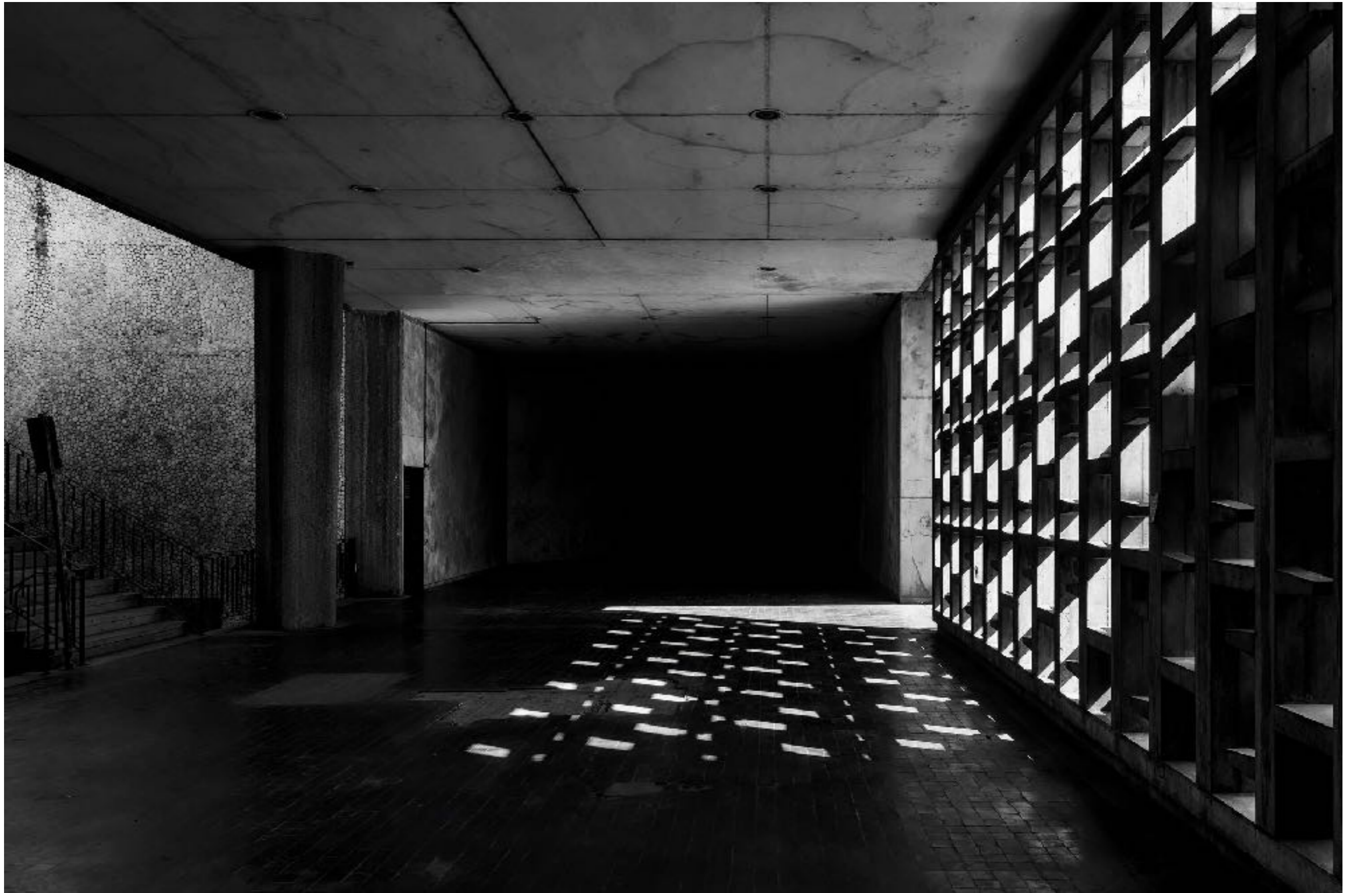
Cementerio Chacarita (Clorindo Testa)